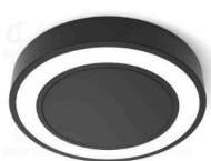
HOLL con cubierta

Ideal para cocinas, oficinas y espacios de trabajo, proporciona una iluminación eficiente y ajustable, mejorando la visibilidad y el ambiente en cualquier entorno.