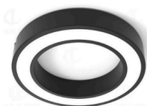
HOLL sin cubierta