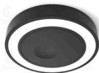
HOLL con sensor